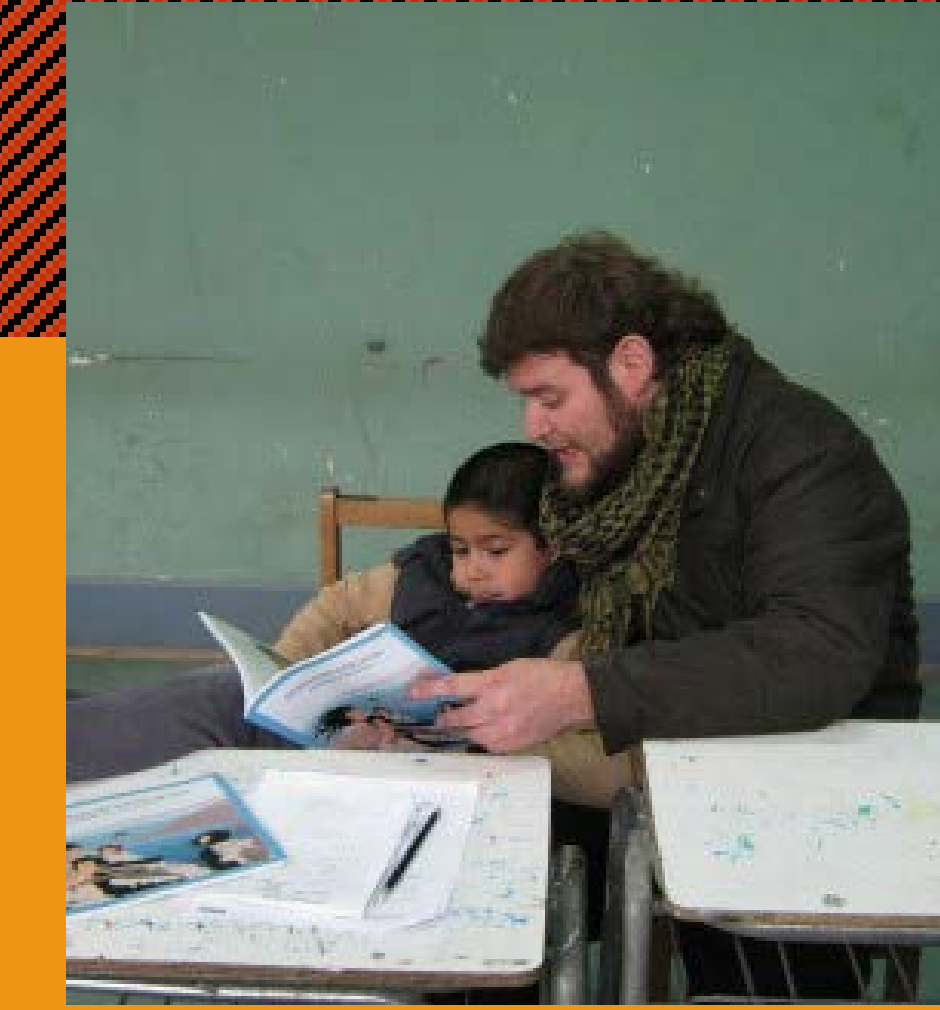
Estudiantes municipales de SPE participan en tutoría grupal e individual